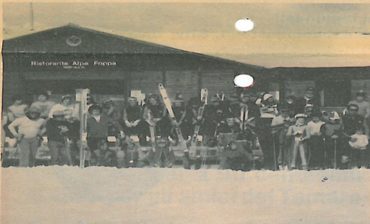
I membri del Tamaro Team davanti al ristorante dell'Alpe Foppa

Il Tamaro Team ha attualmente più di 30 aderenti che nella magnifica zona del Tamaro hanno già svolto numerosi allenamenti.